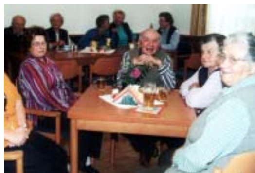
Gemütliche Stunden im Seniorenzentrum!

Singen tut Körper und Seele wohl. Deshalb kommen wir einmal im Monat zusammen und singen miteinander. Nächster Termin: Dienstag, 6. Dezember (Nikolo), 15 Uhr. Ab 14 Uhr: Möglichkeit zum gemütlichen Nachmittagskaffee