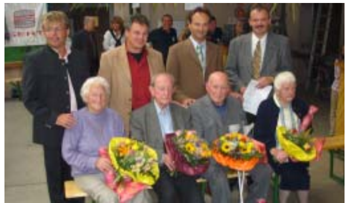
Den ältesten Besuchern und Geburtstagskindern wurde gratuliert.

Höhepunkt war die Ehrung der ältesten Besucher, sowie derjenigen die kürzlich ihren Geburtstag feierten. Zum Abschluss wurden unter allen Besuchern Gutscheine der Regauer Gasthäuser verlost.