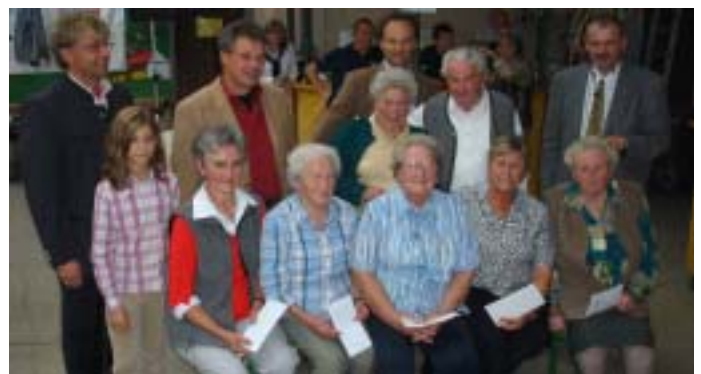
Die Gewinner der Gasthaus-Gutscheine.