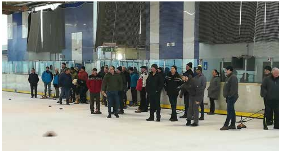
Die Marktmeisterschaften im Eisstockschießen waren auch heuer wieder geprägt von Fairness und Freude am Sport.