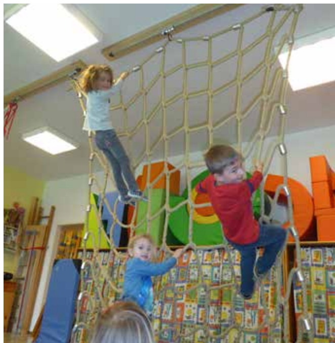
Die Begeisterung über die neue Anlage kennt keine Grenzen.

Herzlichen Dank aus dem Kindergarten Rutzenmoos! Die Kinder sind begeistert!