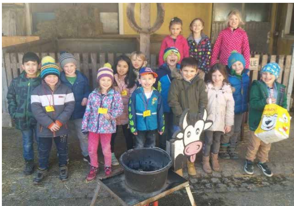
Die Vorschulklasse verbrachte schöne Stunden am Erlebnisbauernhof in Pilsbach.

Besonders beeindruckend waren die Streichelmomente mit den Tierbabys.