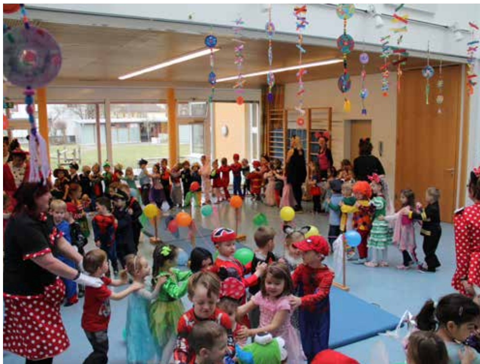
Viel Spaß hatten die Kinder am Faschingsdienstag im Kindergarten Regau.

Am Faschingsdienstag verwandelte sich der Kindergarten in ein kunterbuntes Faschingsreiben. Viele tolle Kostüme präsentierten