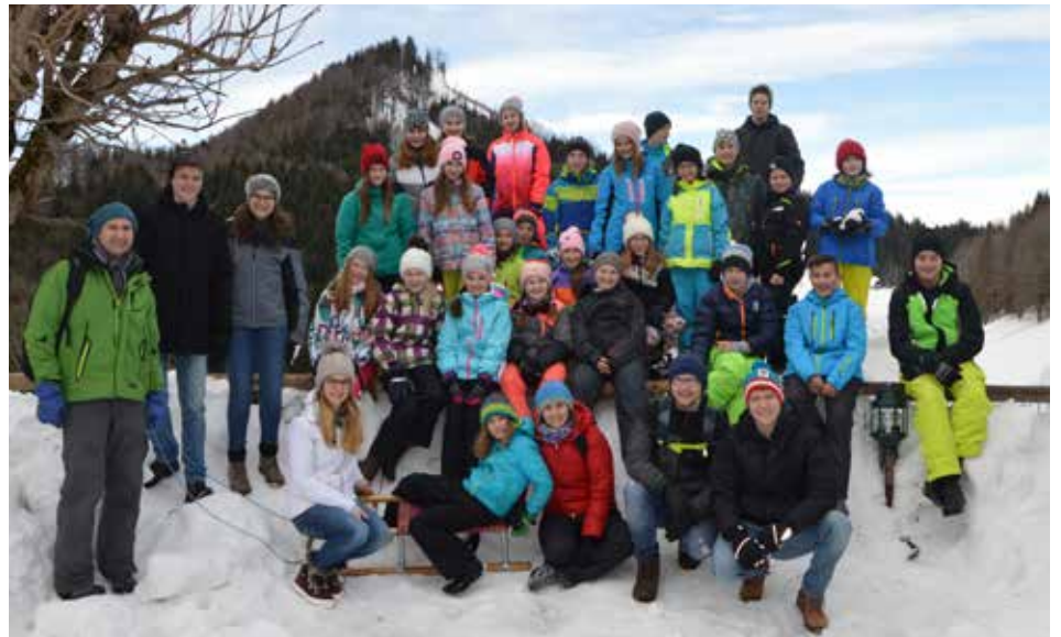
Viel Spaß hatte das Jugendorchester beim Schlittenfahren auf der Hochsteinalm.

Nach einer kurzen Pause ging es mit dem Schlitten wieder runter. Nach einer sehr lustigen und schnellen Fahrt fuhren wir noch ins Gasthaus Haslinger, wo wir unser wohlverdientes Mittagessen verspeisten und den Tag in gemütlicher Atmosphäre ausklingen ließen.