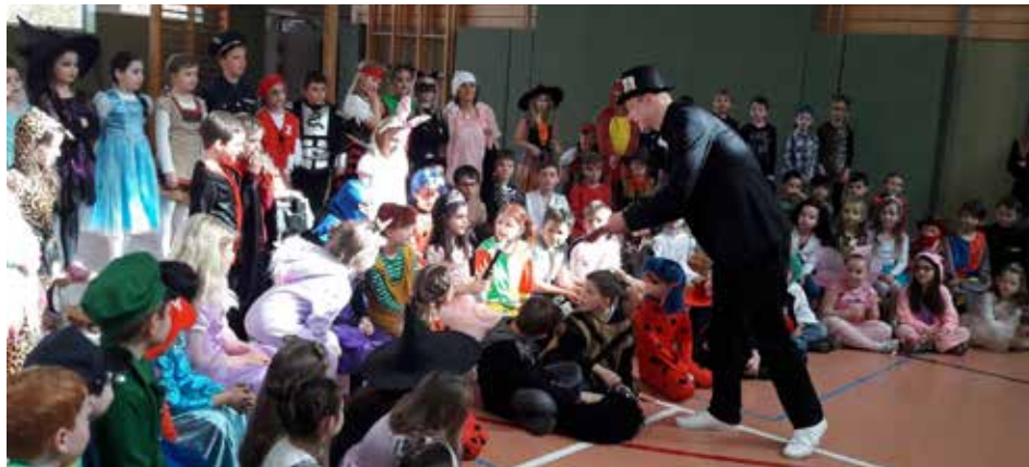
Einen zauberhaften Faschingsdienstag erlebte die Volksschule Regau.

Herzlichen Dank für das Willkommen sein.