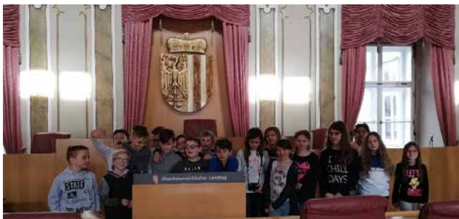
Die 4a und 4c Klasse verbrachten einen schönen Tag in Linz.

Dort durften die Kinder Themen, die sie interessieren, vorbringen und darüber abstimmen.