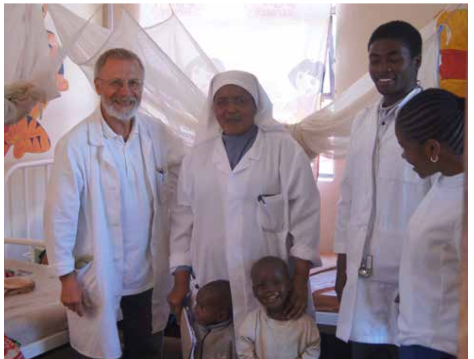
Hilfe zur Selbsthilfe im Kinderspital Wasso (Tansania).

Genauso wichtig wie die medizinische Hilfe ist dort die Ernährung und Aufklärung darüber. Denn durch die extrem einseitige Ernährung wird oft wieder der medizinische Erfolg zunichte gemacht.