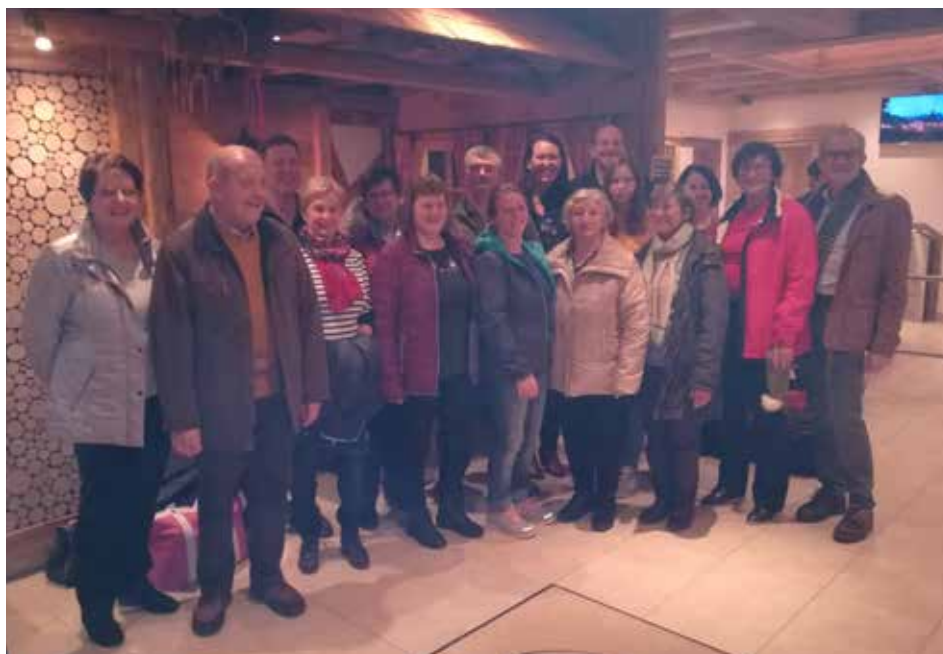
Einen schönen Wellnessstag verbrachten die Teilnehmer in St. Wolfgang.

Der Ausschuss für Gesundheit, Sport und Freizeit freut sich über die zahlreiche Teilnahme.