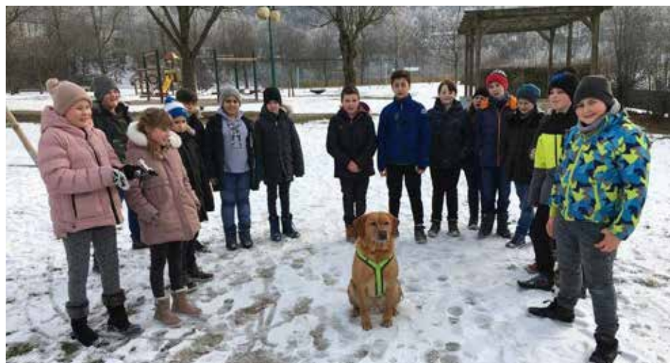
Einen schönen Nachmittag verbrachten die Kinder der 1a Klasse mit dem Schulhund Brösel.