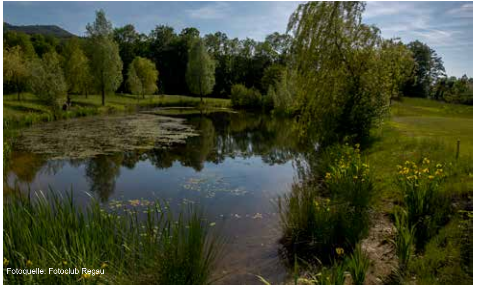
Im Pfarrheim Regau veranstaltete der Verschönerungsverein Regau einen Vortrag zum Thema „Wasser im Garten“.

Interessante Bilder und Wissenswertes über die vielseitige Verwendung und Nutzung von Wasser im Garten in Zeiten des Klimawandels machten den Abend zu einem kurzweiligen Erlebnis. Unter anderem wurden Pflanzen vorgestellt, die nicht viel Wasser brauchen und es gab Anleitungen und Tipps zum sparsamen Gießen und Umgang mit Wasser. Nach dem Vortrag gab es noch Zeit zum Plaudern und ein kleines Buffet, dessen Erlös für einen guten Zweck gespendet wurde.