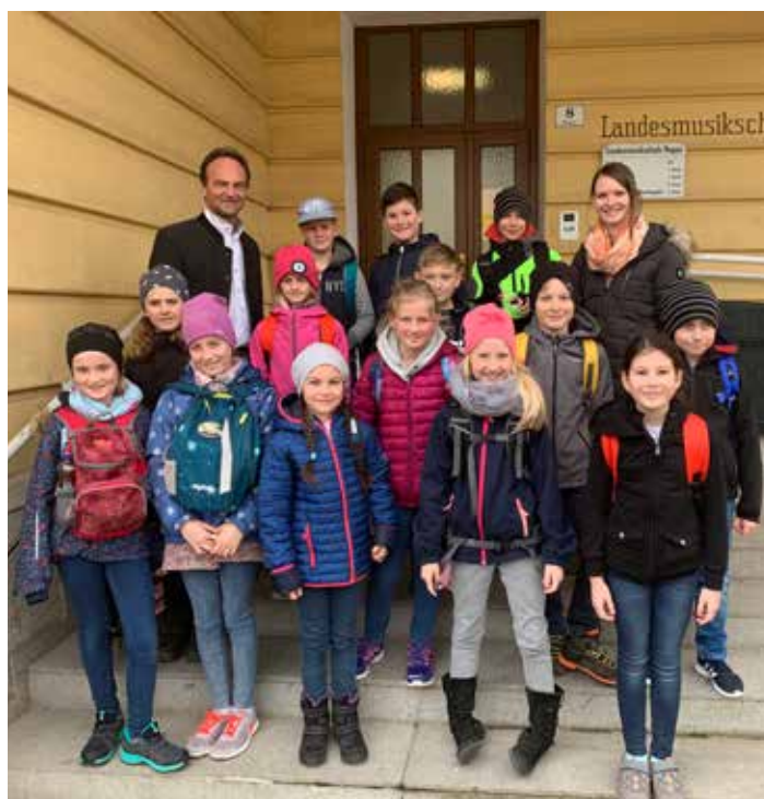
Die 3b Klasse zu Besuch bei Bürgermeister Peter Harringer.