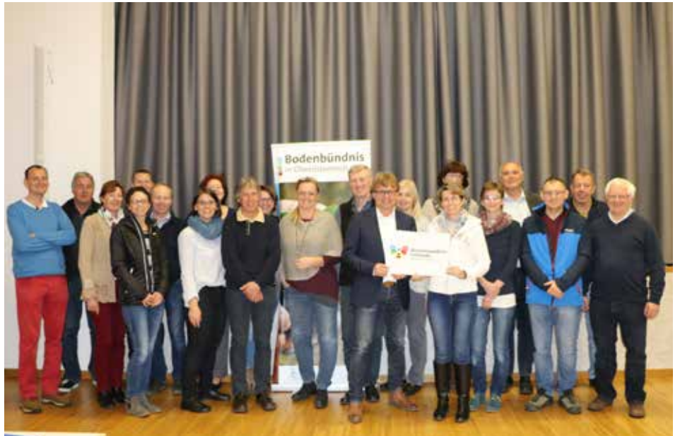
Die Teilnehmer starten sehr motiviert in die Gartensaison.

Die Marktgemeinde Regau ist seit Herbst 2018 „Bienenfreundliche Gemeinde“ und gehört somit zu den fünfzehn Oö. Gemeinden, die sich 2018/19 am Projekt beteiligt haben und bienenfreundliche Ideen entlang