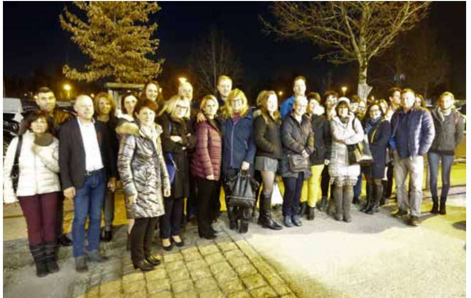
Einen schönen Abend verbrachten die Teilnehmer beim Musical „BEAT IT“ in der Salzburgarena.

Und Sie wurden auch nicht enttäuscht. Ein aufsehenerregendes Bühnenset, spektakuläre Showeffekte, beeindruckende Tanzchoreographien und über 150 aufwendig gestaltete Kostüme erzeugten gemeinsam mit einem hervorragenden Michael-Jackson-Double absolutes Gänsehautfeeling. Während der ca. zweistündigen Hommage wurden die Schritte des Superstars im