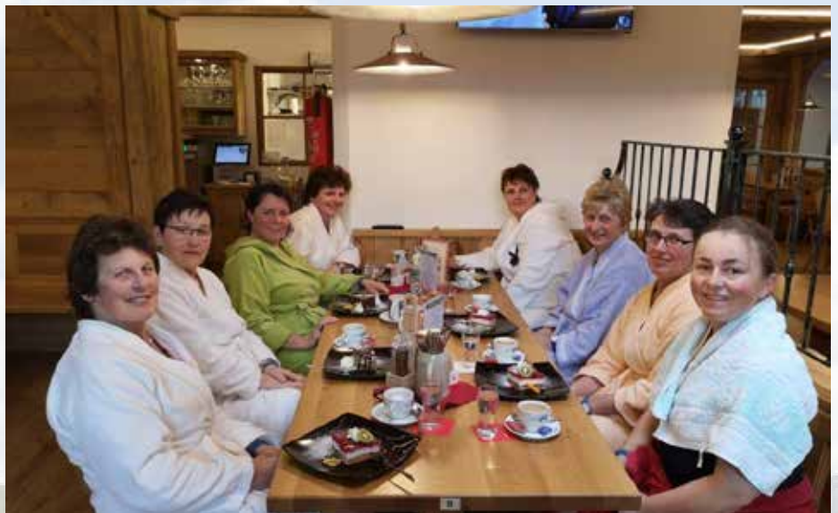
Einen erholsamen Tag in der Wellness-Alm in St. Wolfgang verbrachten die Ortsbäuerinnen.

Wir werden uns in der kommenden Zeit hauptsächlich auf die Arbeit in Haus,