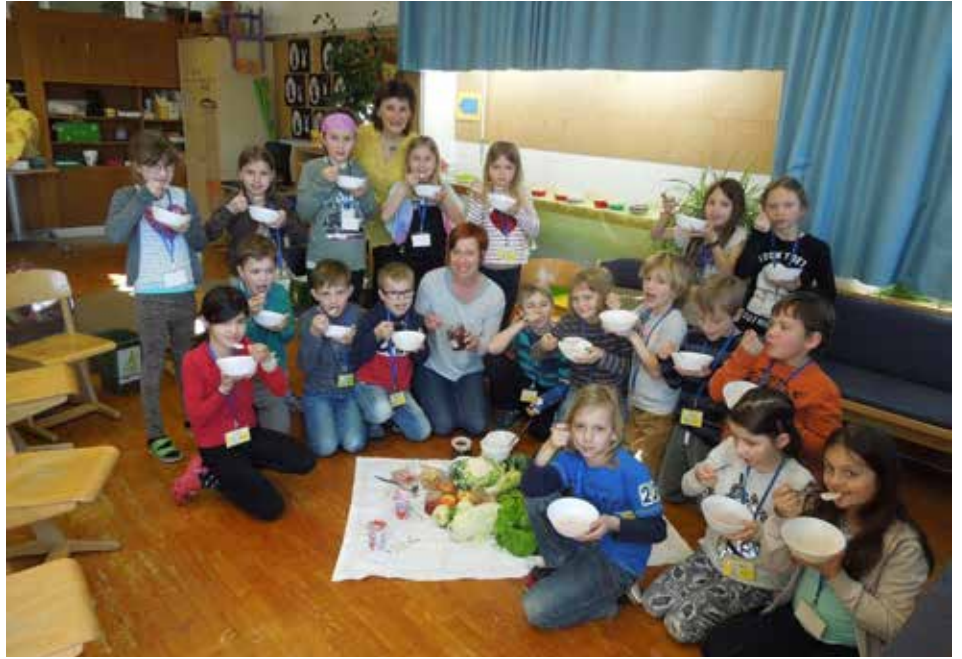
Das Erleben mit allen Sinnen stand bei den 2. Klassen der Volksschule Regau im Vordergrund.