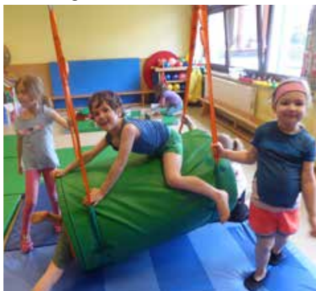
Alle neuen Geräte wurden ausgiebig „beturnt“.

Unser 40 Jahre alter Bewegungsraum wurde nun laufend adaptiert und es ist jetzt zu einer richtig tollen Sache mit vielen Bewegungsanlässen geworden.