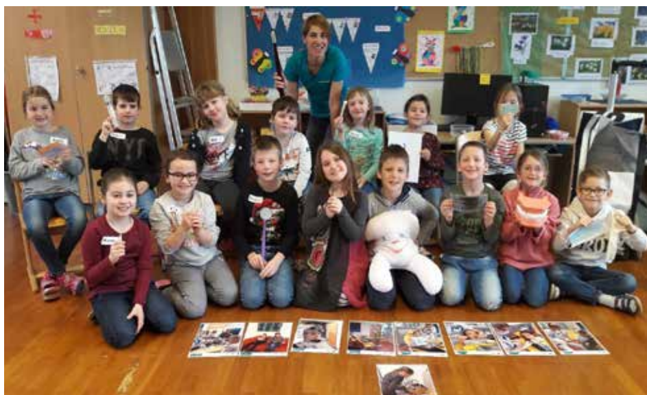
Die Zahngesundheitserzieherin besuchte die Volksschule Regau.

Leider kommt die so begehrte und beliebte „Zahntante“ nicht mehr jährlich in alle Klassen, sondern nur mehr in die 2. und 4. Klassen – SCHADE!