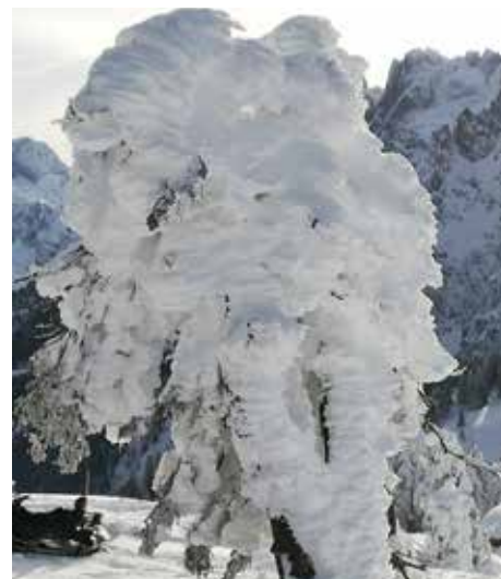
Der Schnee verzierte Bäume, Häuser und die Landschaft in Gosau.