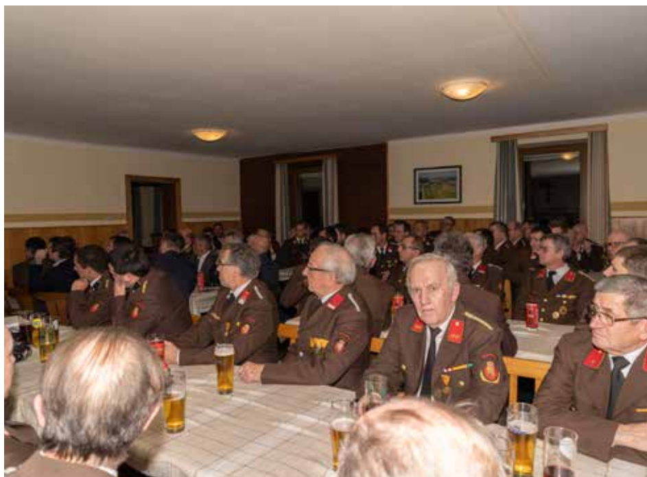
Die 119. Vollversammlung fand am 18. Jänner 2019 im Gasthaus Schobesberger statt.

Damit wir unsere Einsätze unfallfrei und professionell abwickeln können, ist die ständige Weiterbildung notwendig. So besuchten mehrere Kameraden neben den internen Schulungen und praktischen Übungen wieder Lehrgänge an der Landesfeuerwehrschule und im Bezirk. Zusätzlich stellten sich 24 Kameraden dem Branddienstabzeichen in der 1. Stufe (Bronze), bei dem verschiedene Brandeinsatzszenarien abgearbeitet werden müssen.