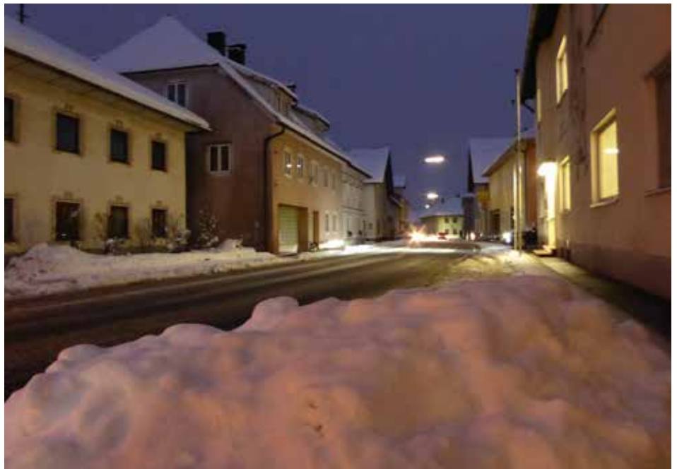
Das Straßennetz von Regau hat eine Länge von ca. 180 km.

Diese Einsätze unter schwierigen Witterungsbedingungen sind für unsere Mitarbeiter häufig sehr fordernd und kräfteraubend. Wir ersuchen Sie daher, Verständnis dafür aufzubringen, dass nicht überall gleichzeitig perfekt geräumt und gestreut sein kann. Unsere Mitarbeiter arbeiten alle Straßen nach einer festgelegten Prioritätenliste ab. Wir ersuchen Sie aber in Ihrem eigenen Interesse ihr Fahrverhalten den winterlichen Bedingungen ebenso anzupassen, wie ihr