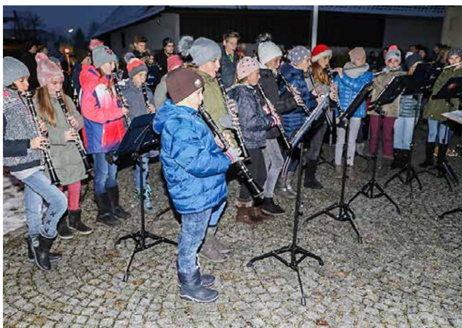
Das Jugendorchester stimmte mit vorweihnachtlichen Liedern in den Advent ein.

Der Advent ist eine ganz besondere Zeit im Jahr. Das Jugendorchester Regau stimmte am Vorplatz der Pfarrkirche nach der Adventkranzweihe auf diese schöne Zeit mit vorweihnachtlichen Liedern darauf ein.