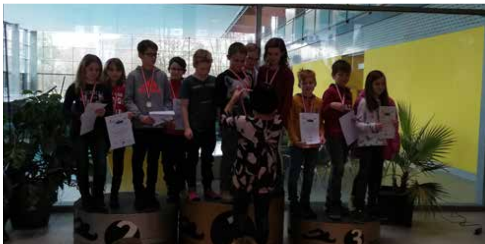
Bei den Bezirksmeisterschaften im Schwimmen erreichten die Kinder den zweiten Platz.