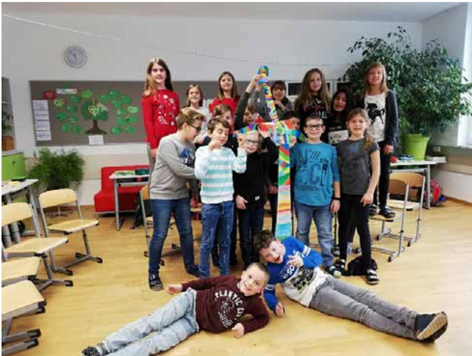
Beim Workshop „Erneuerbare Energie“ bauten alle Kinder ein eigenes kleines Windrad.

In einem abwechslungsreichen Workshop über „Erneuerbare Energiequellen“ erfuhren die Kinder der 4c Klasse in spielerischer Form über die Vorteile der Biomasse, Sonnenenergie, Wasserenergie