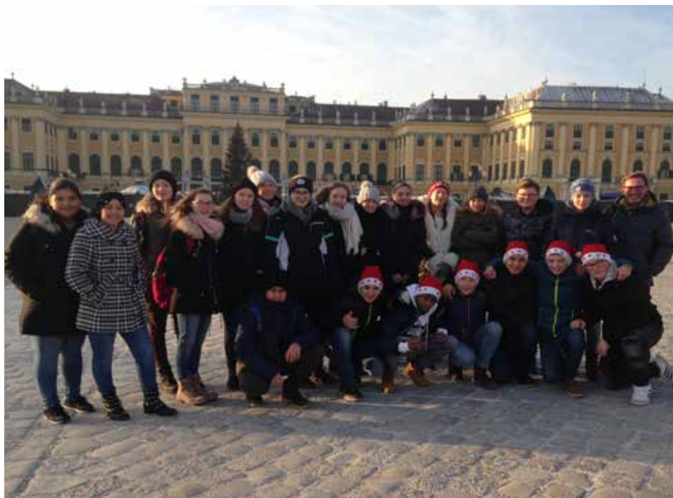
Eine schöne Woche in Wien verbrachten die Schülerinnen und Schüler der 4b Klasse aus der Neuen Mittelschule in Wien.

Dem folgten ein Besuch des Christkindelmarktes am Rathausplatz, eine Busrundfahrt durch Wien und ein Praterbesuch einschließlich einer Fahrt mit dem Riesenrad. Erholen konnte man sich dann in den gemütlichen Stühlen des Planetariums. Den Abschluss der Woche bildete ein Be-