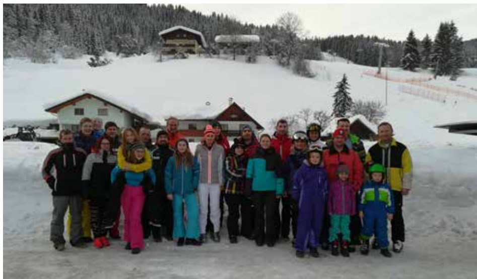
Die Teilnehmerinnen und Teilnehmer des Skitages genossen einen schönen Tag in Gosau.

Der Sportausschuss freut sich schon auf den Wellnessstag und auf einen Skitag im nächsten Jahr und bedankt sich bei dem Busunternehmen Schranzinger.