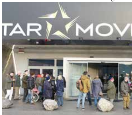
Bewaffnet mit Popcorn und Getränken blickten die Klienten der Lebenshilfe erwartungsvoll der kostenlosen Kinovorstellung entgegen.