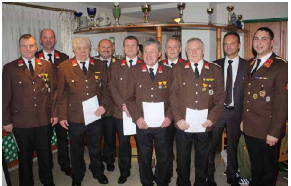
Ausgezeichnet für 25, 40 und 50 Jahre im Dienste der Öffentlichkeit.

250 der 307 Einsätze waren technischer Art. Neben der hohen Anzahl von Verkehrs-