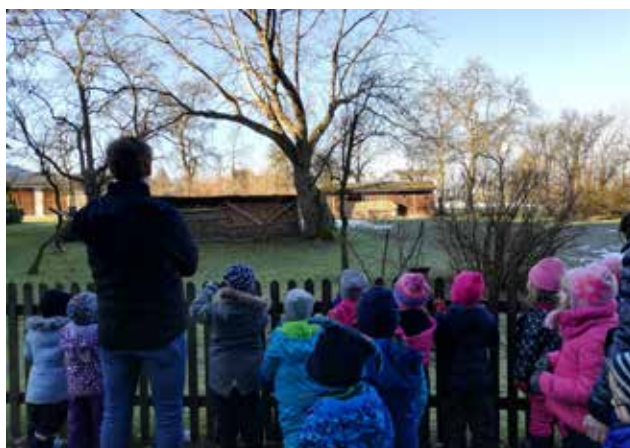
Wer entdeckt Riki?

Diese faszinierende Auseinandersetzung mit der Natur hat eine große Bedeutung für die kindliche Entwicklung. Nicht nur die Wissensstruktur wird erweitert, sondern auch das Denken weiterentwickelt. Weiters üben die Kinder eine sorgsame und achtsame Haltung gegenüber ihrer Umwelt. Ihre große Begeisterung für das Beobachten der belebten und unbelebten Natur befähigt sie zunehmend zum Klären und Deuten ihrer Umwelt.