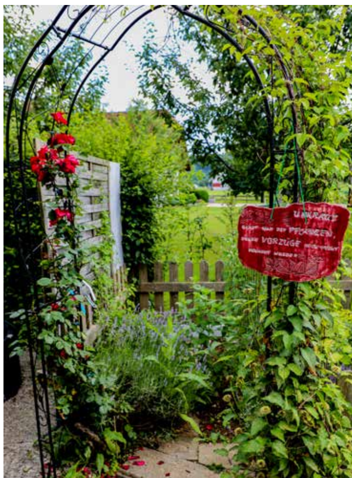
Am Sonntag, 23. Juni 2019 findet der „Tag der offenen Gärten“ statt.

Die Freude am Garten und der Erfahrungsaustausch stehen im Vordergrund, es wird keine Bewertung vorgenommen. Die teilnehmenden Gärten brauchen keine bestimmten Kriterien erfüllen, jede Gartenphilosophie ist willkommen.