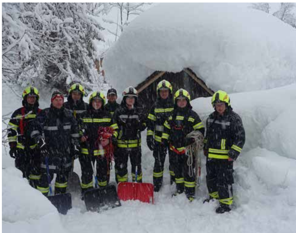
Am 14.01.2019 unterstützten 19 Kameraden der Feuerwehren Regau und Rutzenmoos die Feuerwehr in Gosau.

Die Mannschaft der FF Regau räumte gemeinsam mit den Kameraden der FF-Attang und FF-Puchheim den ADEG-Markt (einziger Nahversorger in Gosau) und die Mannschaft der FF Rutzenmoos befreite mit der FF Aurach Privathäuser von den Schneemassen.