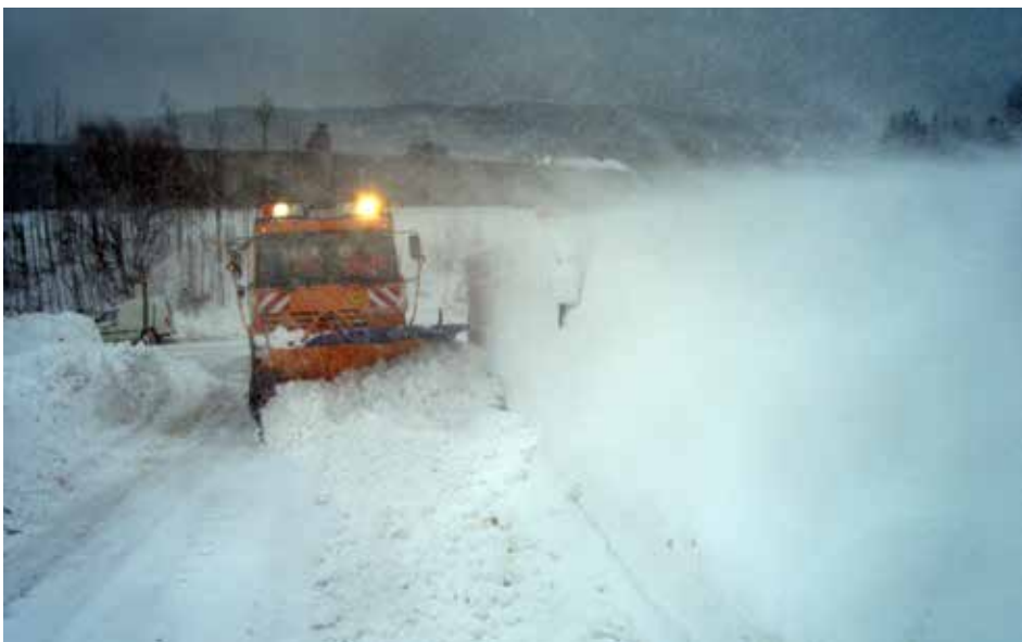
Schneeverwehungen sind ein häufiges Problem bei exponierten Stellen.

„(1) Die Eigentümer von Liegenschaften in Ortsgebieten, ausgenommen die Eigentümer von unverbauten, land- und forstwirtschaftlich genutzten Liegenschaften, haben dafür zu sorgen, daß die entlang der Liegenschaft in einer Entfernung von nicht mehr als 3 m vorhandenen, dem öffentlichen Verkehr dienenden Gehsteige und Gehwege einschließlich der in ihrem Zuge befindlichen Stiegenanlagen entlang der ganzen Liegenschaft in der Zeit von 6 bis 22 Uhr von Schnee und Verunreinigungen gesäubert sowie bei Schnee und Glätteis bestreut sind. Ist ein Gehsteig (Gehweg) nicht vorhanden, so ist der Straßenrand in der Breite von 1 m zu säubern und zu bestreuen.“