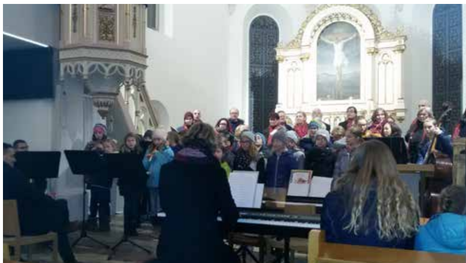
Die Kinder der Volksschule Rutzenmoos beeindruckten mit drei Advent- und Weihnachtsliedern die Gäste.