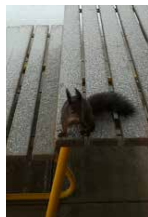
Riki besucht uns im Garten.