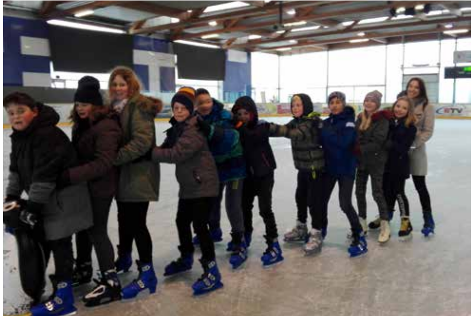
Ein paar schöne Stunden verbrachten die Kinder der GTS Regau beim Eislaufen.

Den Nachmittag rundet noch eine Freizeiteinheit ab, in der Sport, Kreatives und Spielen auf dem Programm stehen. Auch an unterrichtsfreien Tagen besteht die