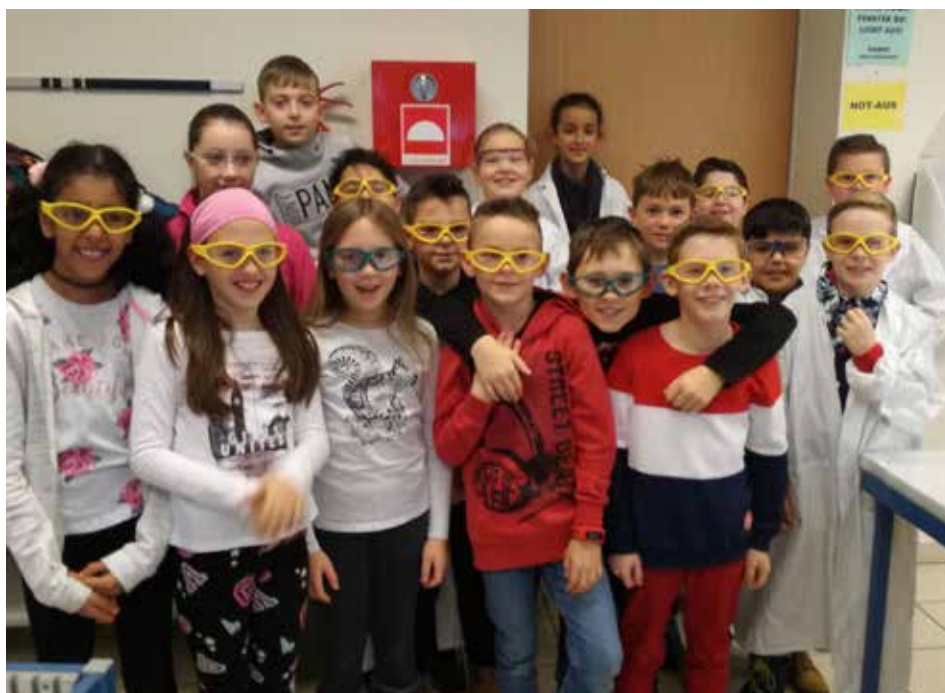
Einen schönen Tag verbrachten die Kinder im Bundesrealgymnasium Schloss Wagrain.

Die Kinder hatten Freude beim Ausprobieren von aufregenden chemischen Zaubereien und beobachteten mit Spannung fantastische Phänomene.