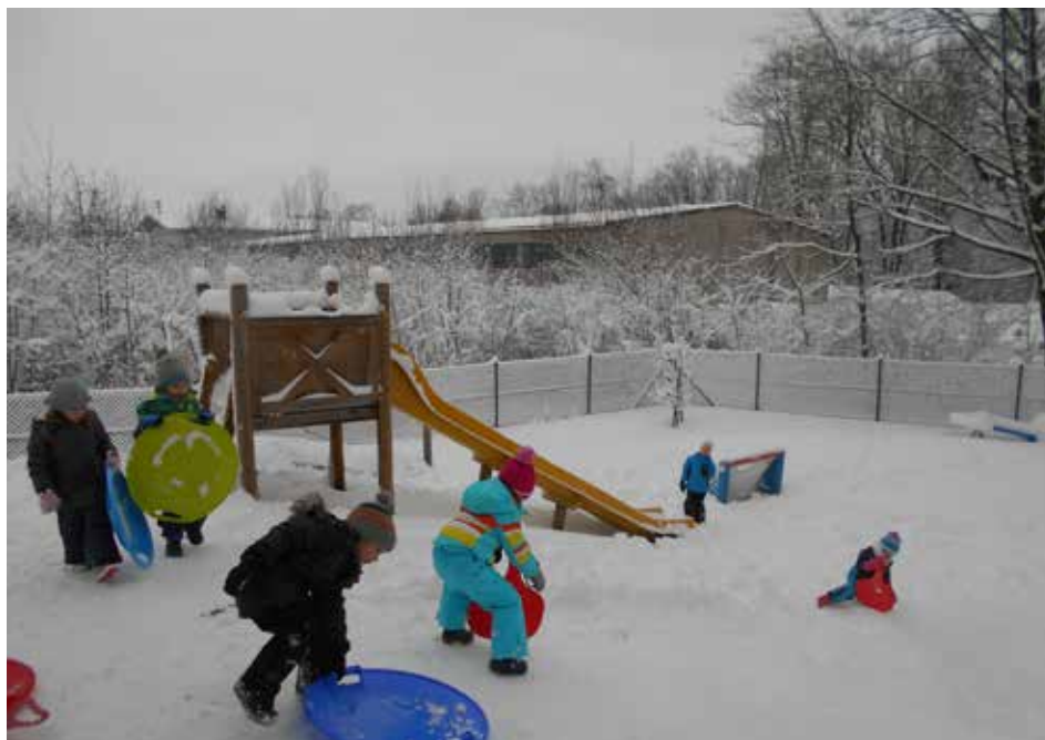
Viel Spass hatten die Kinder beim Bob- und Schlittenfahren im Kindergarten.

Hier wird es allen Kindern ermöglicht, den Spaß an Bewegung auf dem Eis zu entdecken.